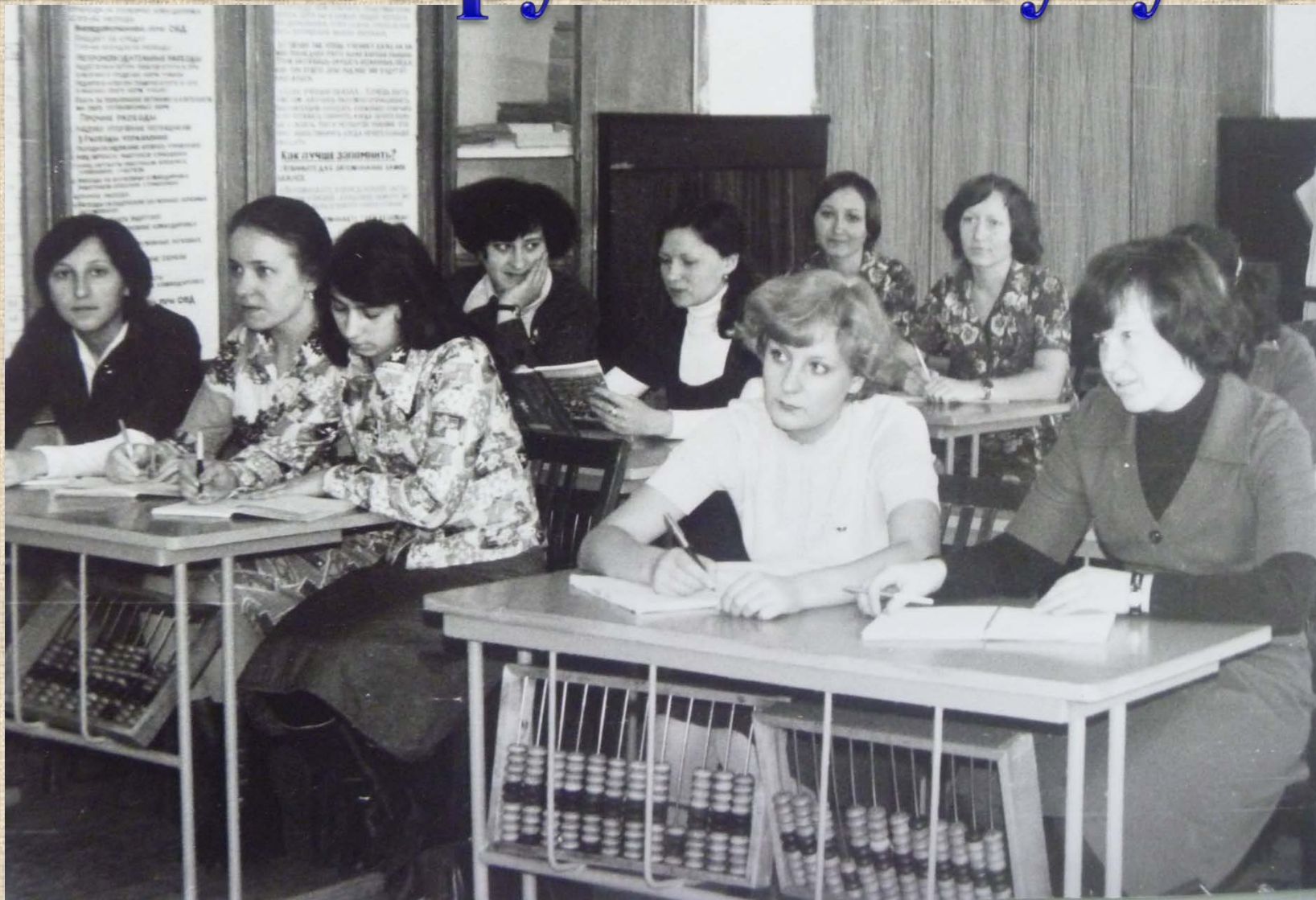
Организационное занятие членов кружка бухучета, 1979-1980 гг.