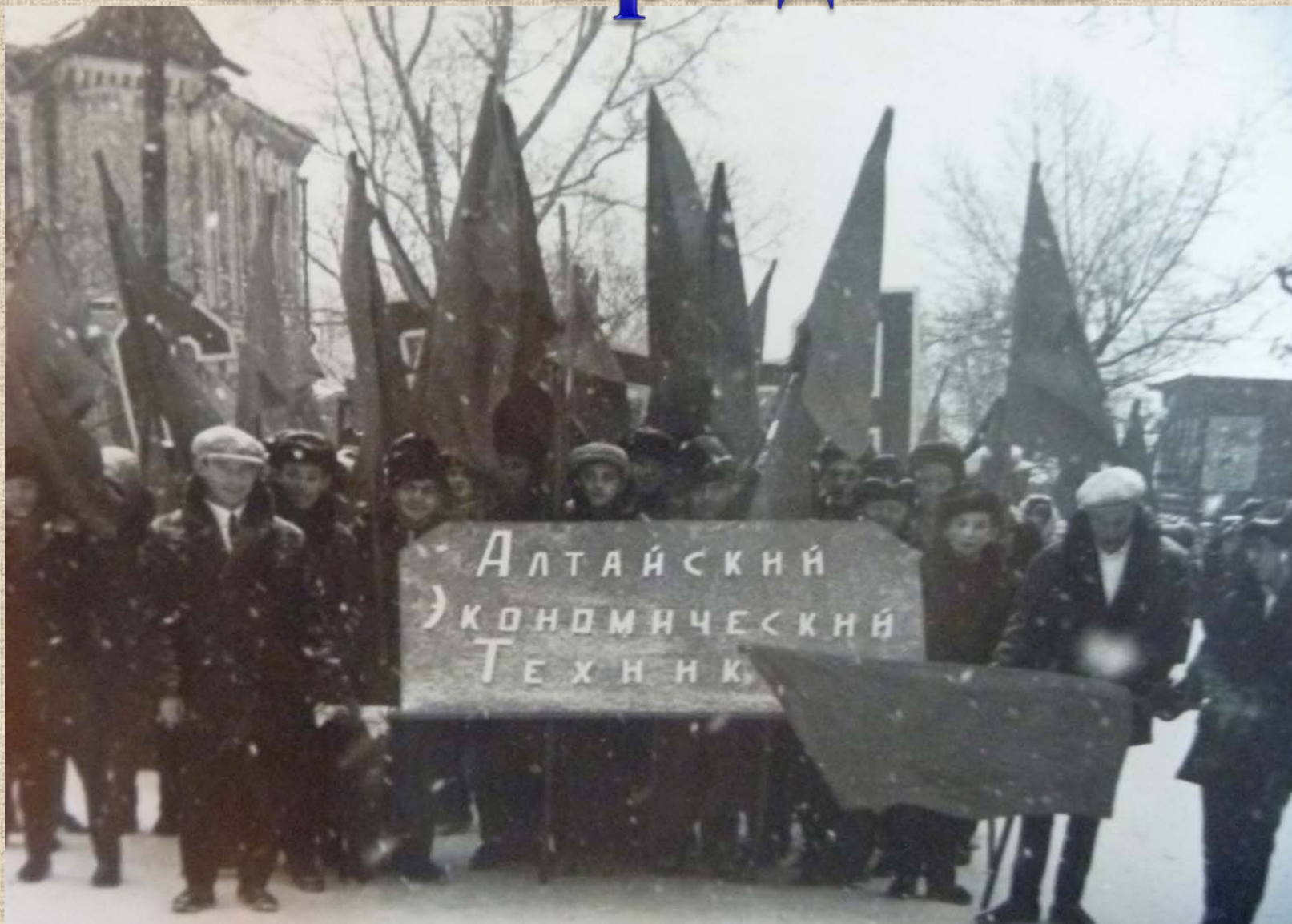
АЭТ на демонстрации