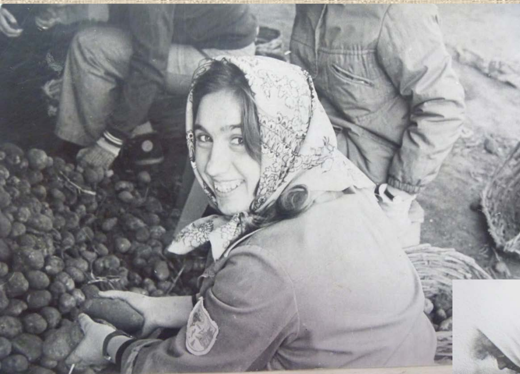
Группа Б-21 на уборке свеклы, 1983 г.