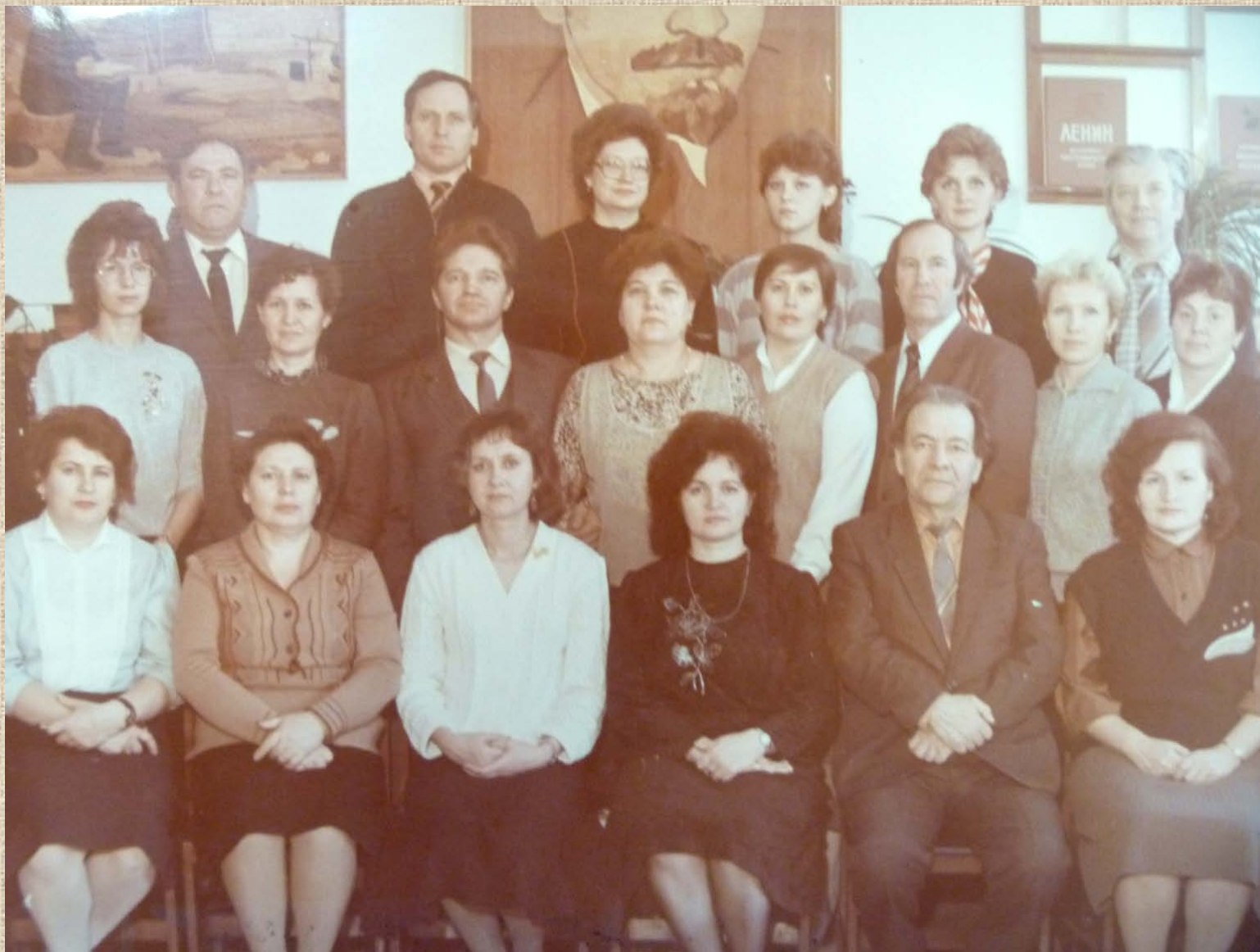
Коллектив преподавателей АЭТ (1987-1988 уч.год)